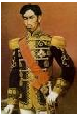
Keiser Mutushito Meiji (Mikado)

I 1853 sender USA krigsskip til Japan, for å tvinge landet til å åpne seg for handel med Vesten. I 1868 opphører Edo-perioden etter et par større slag mellom provestlige Mikado og antivestlige Daimoer. Mikado vinner, Meiji utropes til Keiser, og med det opphører den gamle tiden.