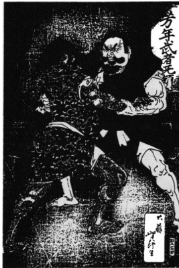
The contest of Nomino-sukune and Taimano-kehaya, from Ukiyo-e prints by Yoshitoshi (1839-1892).

I De Japanske kroniklene, Nihon Shoki, er det nedtegnet en historie fra år 230 f.kr, som forteller om en nærkamp konkurranse. Kampen sto mellom Takemi-kazuchi-no-kami og Takemi-nakata-no-kami. Det fortelles at Takemi-kazuchi-no-kami tar tak i sin motstanders albueledd, og kaster sin motstander i bakken. Etter denne seieren blir han gjort til hersker. En annen nærkamp konkurranse ble holdt mellom Nomino-sukune og Taimano-kehaya. Nomino-sukune slår sin motstander i brystet, kaster motstanderen i bakken, og sparker ham til døde.